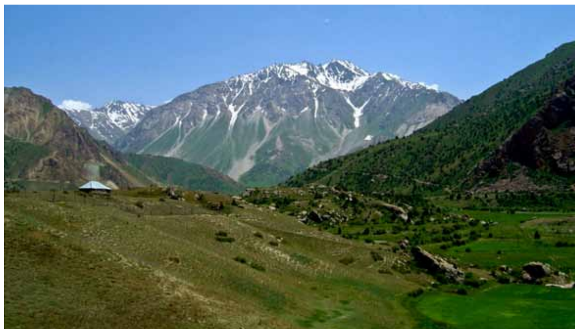
Большую часть территории Таджикистана составляют горные невозделанные площади.

К концу 2009 года общая сумма кредитов, одобренных АБР для Таджикистана, составляла 372,5 миллионов долларов США на 23 кредита, 34,6 миллиона долларов США на техническую помощь, а также 162,4 миллиона долларов США