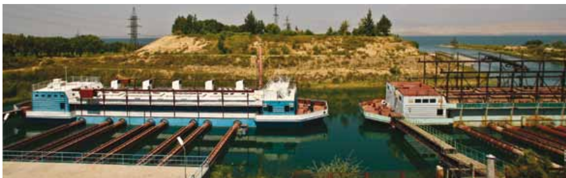
Эта плавающая насосная станция находится в Ходжабакиргане Бободжон Гафуровского района, на берегу Кайракумского водохранилища.

Проект по восстановлению сельского хозяйства принес пользу орошаемой территории площадью 85,000 га с населением 471,500 человек