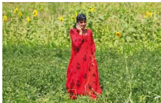
Сельские женщины вдоль восстановленного дорожного коридора Душанбе-Республика Кыргызстан получают больше доходов и получили лучший доступ к здравоохранению.

В отчете 2009 года о завершении работ, охватывающем страновую стратегию и программу 2004–2008 гг., говорится, что проекты по восстановлению дорог сталкиваются с проблемой