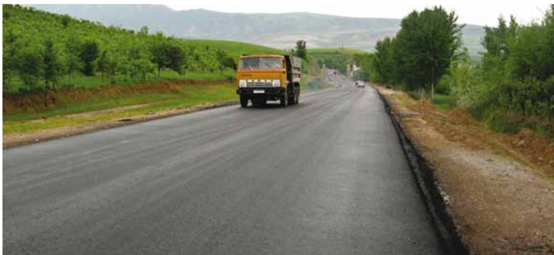
Дальнейшая помощь АБР в транспортном секторе будет сосредоточена на внутренних и региональных коридорах.

АБР содействует Таджикистану в повышении энергетической безопасности и качества энергоснабжения, устранении энергетического дефицита в зимнее время, и максимизации возможностей экспорта излишней электроэнергии, вырабатываемой в летнее время