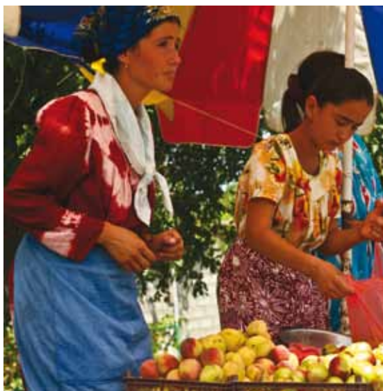
Финансированный АБР Проект по восстановлению сельского хозяйства способствовал увеличению урожая и доходов продавцов фруктов на обочине дороги в районе Бободжон Гафуров.

абрикосов на 18 га земли увеличилось на 25%, и теперь, когда обеспечено надежное водоснабжение, он также планирует расширить свое хозяйство. Ранее он экспортировал продукцию только в Российскую Федерацию, но по мере увеличения производства в этом году он начал отгружать свою продукцию в Афганистан, Иран и Ирак. Он говорит: «Теперь у нас есть автомобиль, мои дети поступят в университет. Мы благодарны за этот проект, он существенно изменил нашу жизнь».