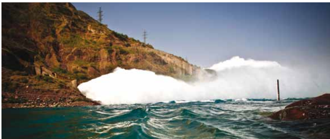
Очистка отводящего канала Нурекской гидроэлектростанции (первоочередная мера) при финансировании АБР позволила увеличить годовую выработку электричества на 95 гигаватт.

АБР активно поддерживал реформирование мер политики в секторе энергетики и предоставлял инвестиции с самого начала деятельности в Таджикистане, предоставив помощь, одобренную в сумме более 250 миллионов долларов США