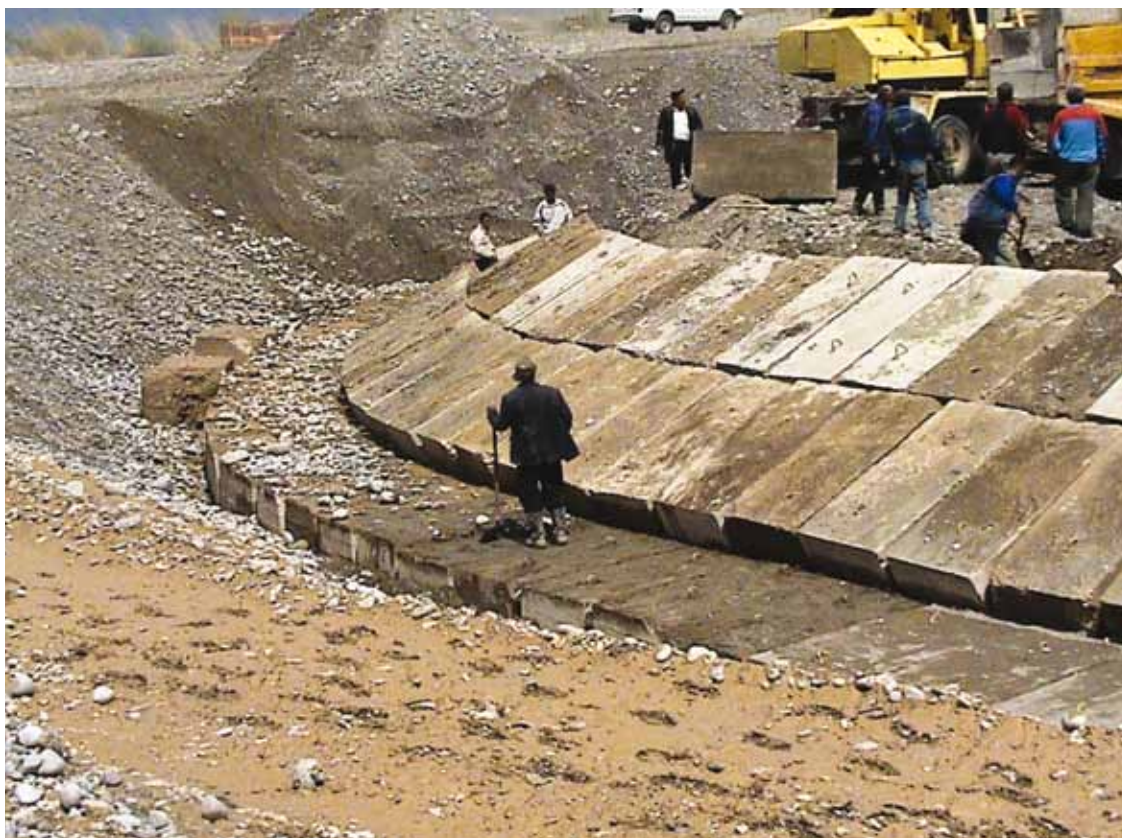
АБР финансирует систему управления рисками наводнений в Хатлонской области.

и распределения. При содействии АБР открыто 93,000 микро-финансовых счетов и предоставлено 79 микро-кредитов бенефициарам. В транспортном секторе АБР осуществлял дорожные проекты по строительству или восстановлению 309 км дорог для более, чем одного миллиона населения. В сельском хозяйстве улучшено 19,776 гектаров (га) земли через осуществление проектов по управлению системами ирригации, водоснабжения и борьбе с наводнениями.